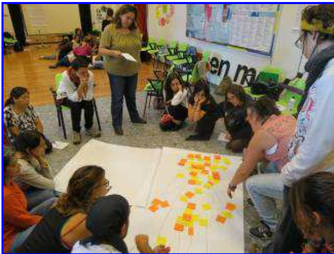
Imagen del desarrollo de las IX Jornadas de Reflexión Pedagógica Paulo Freire: "Resistencias, creativities y alternativas desde la equidad de género"

Facilitamos estrategias, habilidades y técnicas para que las personas puedan llevar a cabo una participación activa orientada a la transformación de la realidad, a la implicación en su entorno, pro-activas frente al desarrollo de sus barrios y municipios, críticas.