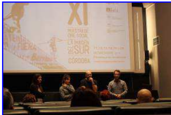
XI Muestra de Cine Social, en Córdoba