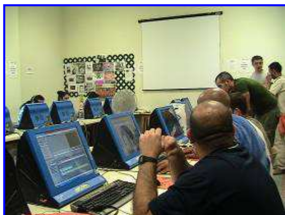
Taller de Informática Básica

Otra línea importante para alcanzar nuestros objetivos es la Alfabetización Tecnológica y la Inclusión Digital en materia de acceso e integración en la