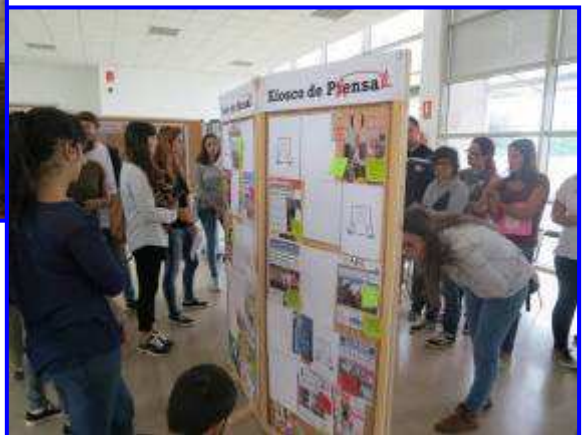
Kiosco de pensar: actividad para hacer entender el derecho humano a la comunicación. Instalado durante el año en IES, Centros Cívicos y Universidades de Andalucía.

Ponemos en marcha y participamos de campañas y actuaciones para la incidencia social en nuestra comunidad, para cambiar las políticas, para lograr que la igualdad y la justicia social sea un hecho en aquellos ámbitos a los que nos dedicamos.