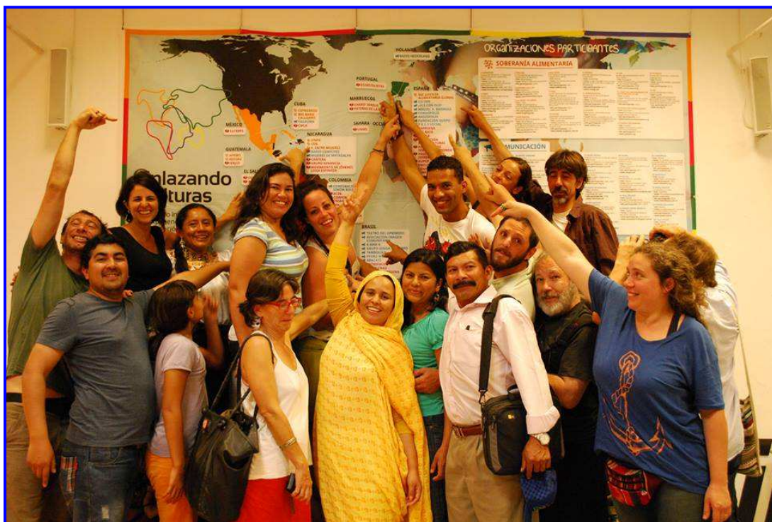
Imagen del Encuentro de educación popular Enlazando Culturas

ASOCIACIÓN CENTRO DE INICIATIVAS PARA LA COOPERACIÓN BATÁ