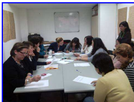
Programa de apoyo a mayores

Otra línea importante de trabajo desarrollada durante los últimos años es la Asistencia al Colectivo de Mayores de la ciudad. A través del desarrollo de actividades encaminadas a fomentar la autoestima de las personas mayores y a dotar de calidad su tiempo de ocio, pretendemos contribuir a paliar las nuevas formas de exclusión generacional e incidir así en el bienestar físico y emocional de nuestros mayores.