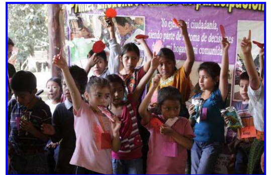
Participación infantil en Guatemala

Trabajamos en la región mesoamericana desde el año 1999 lo cual nos ha permitido vivir y acompañar los principales procesos políticos y sociales de los últimos años en la zona, entre los que se destacan las nefastas consecuencias económicas de los acuerdos de libre comercio suscritos con Estados Unidos y la Unión Europea, el aumento de la brecha entre población empobrecida y enriquecida, la pérdida de derechos generalizada, los efectos del cambio climático y el recrudecimiento de la violencia contra las mujeres (en especial en Guatemala). En positivo debemos destacar el aumento de la organización y movilización comunitaria y popular en defensa de los derechos básicos (en especial los movimientos feministas, juveniles y campesinos), el creciente interés por la innovación, experimentación y emprendimiento campesino y la lucha contra el cambio climático y la conservación del entorno.