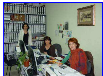
Parte del equipo de administración

Somos un equipo estable de 5 personas (4 mujeres y 1 hombre), con una formación y experiencia acorde a nuestro desempeño y que llevamos años trabajando en la entidad. Tenemos un reparto de tareas bien definido y delimitado, y nos coordinamos entre si y con el resto de áreas de la organización a través de la figura de coordinación.