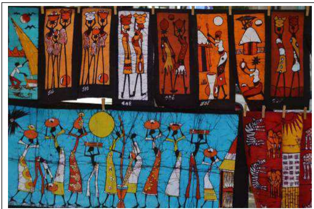
El batik es una combinación de tela, cera y tintes naturales muy tradicionales de Asia, cuyo uso se ha extendido a diversos países de África, entre ellos Mozambique. Representan escenas de la vida cotidiana en las aldeas rurales mozambiqueñas.