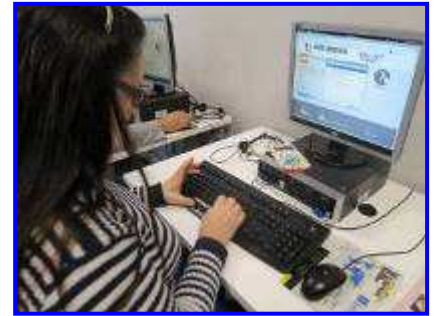
Imagen de una de las sesiones del programa "Comparte tus ideas para otro Mundo Mejor"