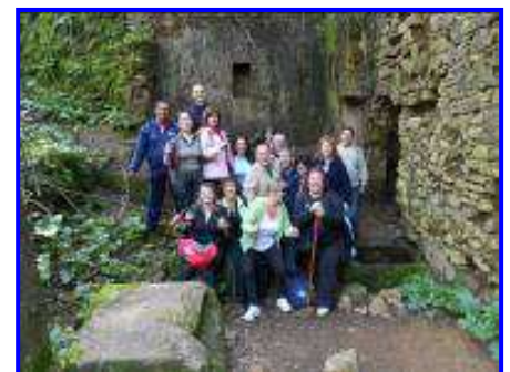
Curso de FPE Tiempo Libre

Trabajamos en el ámbito de la Formación Ocupacional y Continua , organizando, gestionando e impartiendo cursos relacionados con la creación de condiciones para la igualdad de oportunidades en el acceso al empleo; dirigidos tanto a personas desempleadas en general como a personas ocupadas, pero haciendo un gran hincapié en las personas que forman parte de colectivos con necesidades especiales.