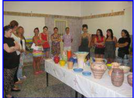
Taller de alfarería en el Centro Penitenciario de Alcalá de Guadaíra

Disponemos de 4 centros, dotados con aulas teóricas e informáticas, repartidos en 4 Zonas con especiales necesidades de Transformación Social (ZTS) de la ciudad de