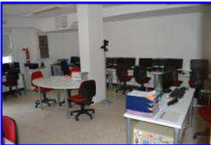
Un aula de nuestros centros homologados

Córdoba, dos de ellos homologados como centros de Formación Ocupacional desde los cuales se imparten cursos en toda Andalucía, y con una oficina en Sevilla; además de colaborar con todos los Centros Penitenciarios de Andalucía, ampliando la oferta de cursos de Formación Ocupacional y estando homologados en los Centros de Córdoba, Sevilla II (Morón) y Alcalá de Guadaíra (Sevilla).