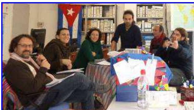
Imagen de parte del equipo, en uno de los encuentros anuales de Evaluación y Planificación

Somos un equipo multidisciplinar de 15 personas (8 mujeres y 7 hombres), que trabajamos de una forma horizontal, participativa y dialogante, realizando planificaciones estratégicas con una fuerte componente político-ideológica y planes operativos anuales donde desarrollamos nuestras destrezas técnicas en gestión de ciclo de proyectos. Realizamos un seguimiento por zonas y, una vez al año, de forma colectiva, en un encuentro de Evaluación y Planificación en el que, en la medida de lo posible, participan las personas que forman parte de Batá pero se encuentran distribuidas en nuestras sedes en el exterior.