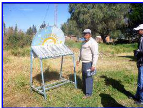
Purificando agua al sol , con materiales reciclados sencillos y asequibles

popular y se lograra estabilizar la economía –a través de la nacionalización de los hidrocarburos-, así como reinvertir una buena parte de los recursos conseguidos en el impulso a medidas de carácter redistributivo y social.